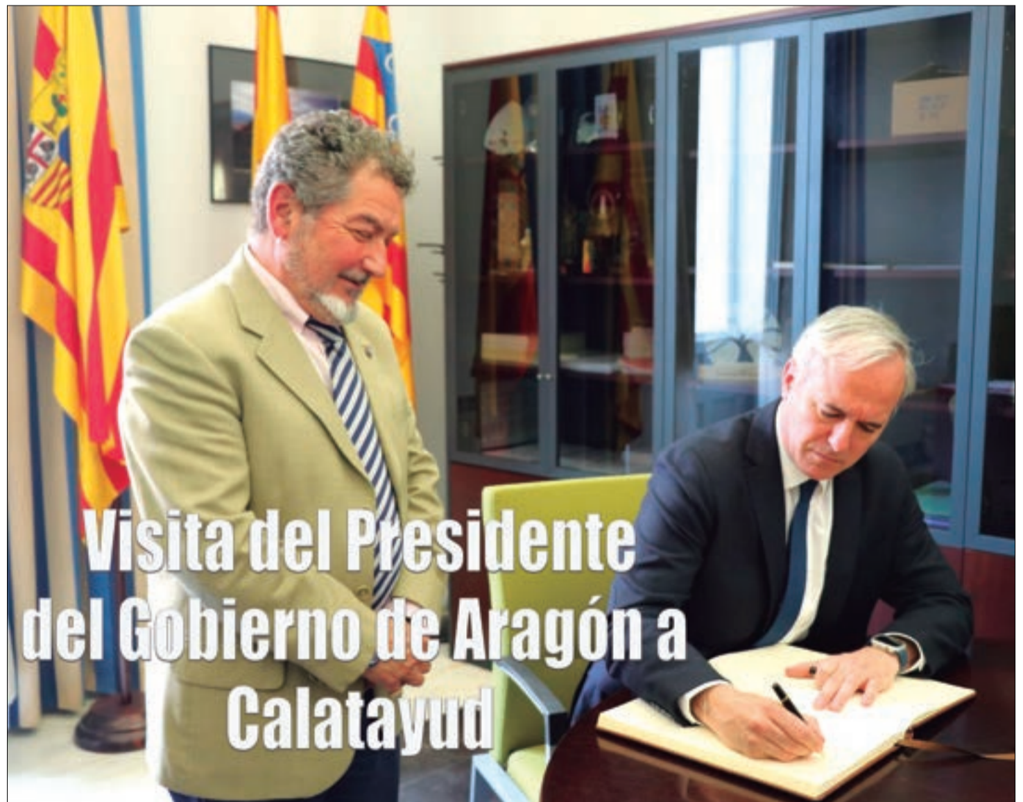
Visita del Presidente del Gobierno de Aragón a Calatayud

En el interior información de: Calatayud, Comarca de Calatayud, DPZ, Aniñón, Arándiga, Montón, Olvés, Ateca, Munébrega, El Frasno, Sediles, Terror, Torrijo Sabián y Miedes.