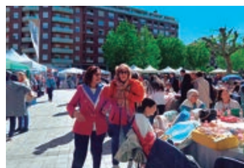
Encuentro de bolilleras