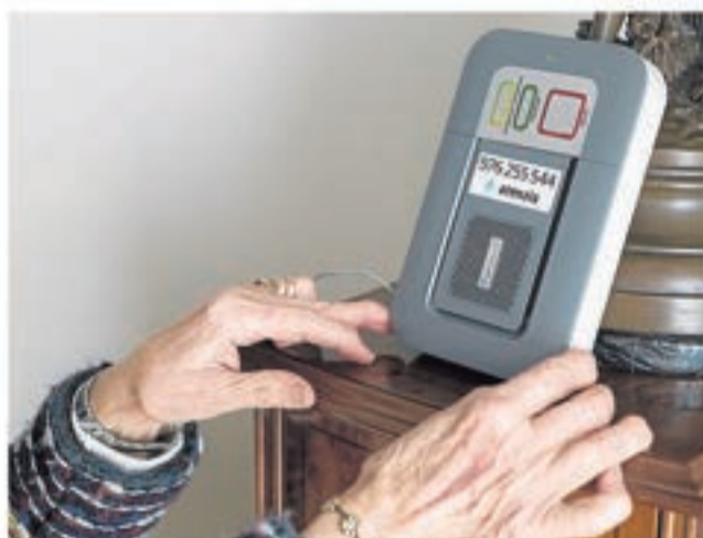
Los terminales se conectan con una central telefónica. A. Z.