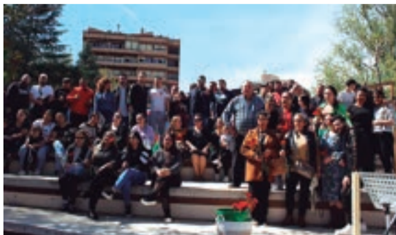
Día Internacional del Pueblo Gitano