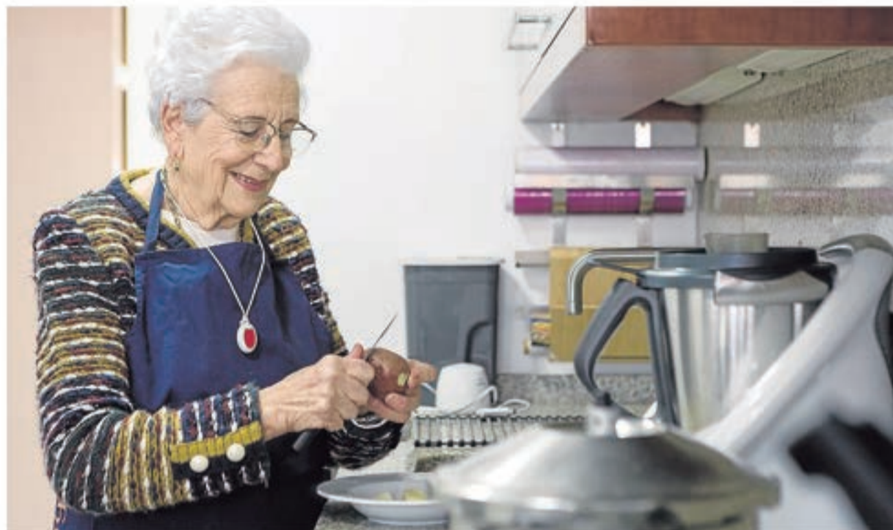
Cuando están en casa, los usuarios llevan colgado un botón que pueden pulsar en cualquier momento. ARÁNZAZU NAVARRO

La Diputación de Zaragoza presta el servicio de teleasistencia en los municipios de la provincia desde 1995 (la capital tiene el suyo propio). Gracias a él, mayores, dependientes y personas con discapacidad disponen de un dispositivo en el que con solo pulsar un botón que pueden llevar colgado del cuello pueden ponerse en contacto con una central telefónica operativa las 24 horas del día los 365 días del año para avisar de cualquier incidencia o emergencia, hacer frente a situaciones