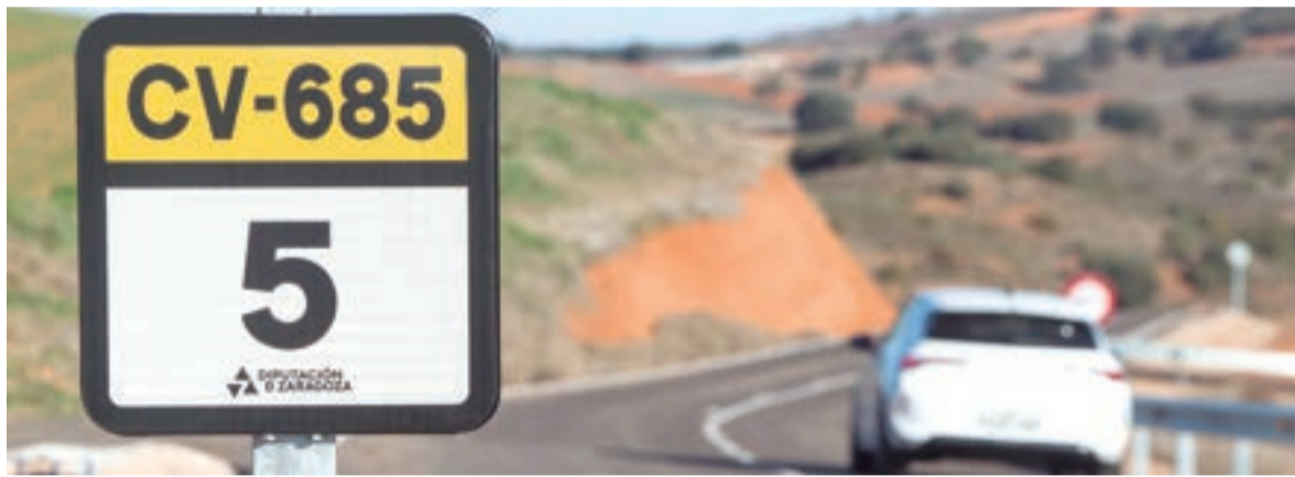
En total la Diputación de Zaragoza va a arreglar 526 kilómetros de su red de carreteras. ALFONSO REYES

La red de carreteras de la Diputación de Zaragoza está formada por 150 vías que en total suman