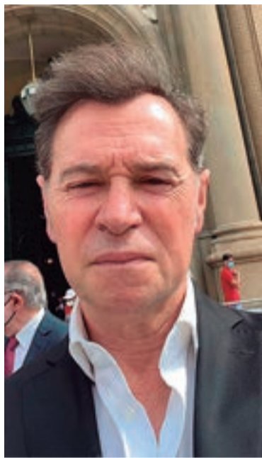
DISEÑADOR, MODISTO Y