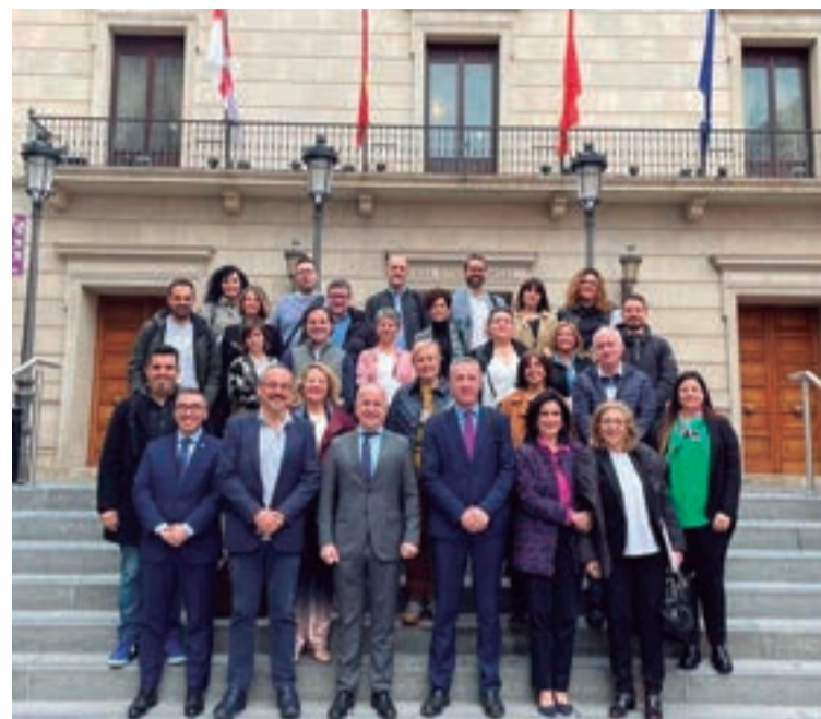
Imagen del último Consejo del Campus Nordeste celebrado en Tudela, 17/marzo/2023

Durante este primer curso, casi 100 personas han participado en el programa académico, que ha ofrecido 6 asignaturas en 3 sedes. La metodología de UNED Sénior, compuesta por clases interactivas, se ha ampliado con varias conferencias, como la que versó sobre el histórico Orient Express, y varias excursiones y actividades culturales, como la visita al Centro de Regulación y Control de la línea del AVE Madrid- Barcelona,