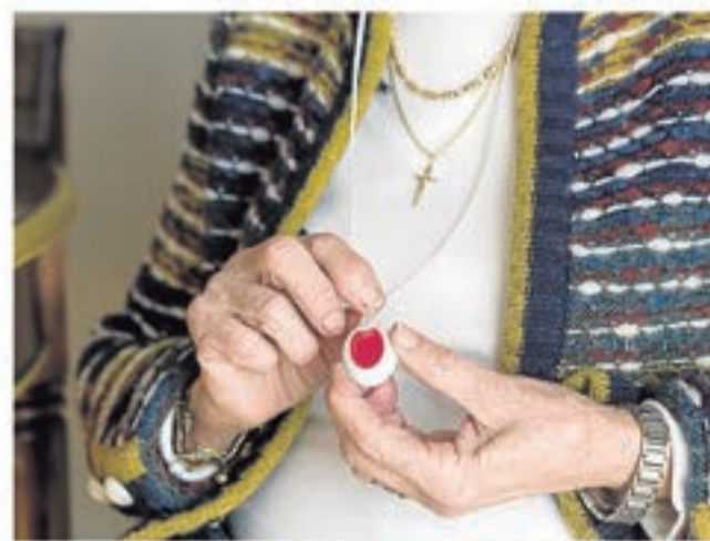
El botón se utiliza para todo tipo de incidencias. A. Z.