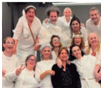
Grupo de teatro CREATE