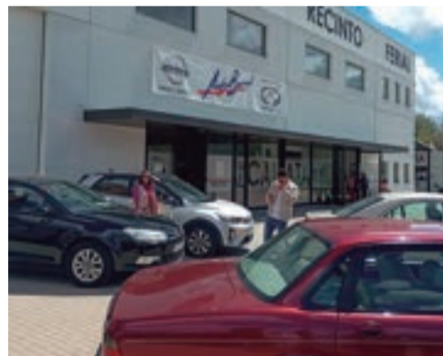
Feria del Automóvil